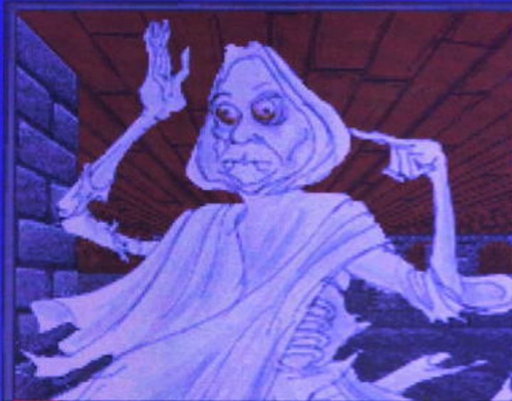
Şeyhler... bendeniz Phantom of

Oyun hakkında kısa bir yorum yapma gerekirse, öncelikle şöyle söyleyeyim, bir oyunu oyun yapan yani gerçekten unutulmamasını sağlayan grafikleri, müzikleri, efektleri değil, sadece atmosferidir. Diğerlerinin bir önemi yok demiyorum, ama bunlar olmadan da gerçek oyuncular için oyun kendisini oynatabilir. Zaten kendini oynatabilen oyunlar ölümsüzler listesine girebilmiştir (bkn. Civilisation). Tamam İstanbul Efsaneleri'nde belki günümüz oyunlarının grafik ve sesi yok, ama gerek Türkçe olmasından gerek de esprilerinden kaynaklanan bir atmosfer var. Zaten oyunun hemen göze çarpan en büyük özelliği esprileridir. Bu oyun kelimenin tam anlamıyla komik. Yahu güleceksiniz diyorum size ya,